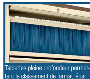
Tablettes pleine profondeur permettant le classement de format légal