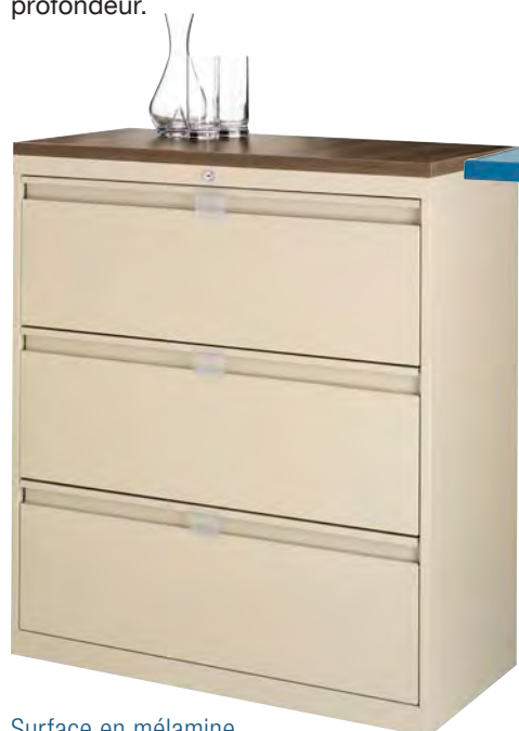
Surface en mélamine

Beige, noir, charbon, gris pâle, Nevada et Colombe.